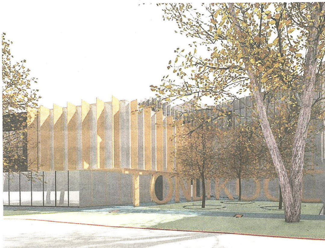
Selline peaks Tondi põhikooli uus maja valmides välja nägema.

Senisest enam lubab uus hoone rakendada ka kogupäevakooli ideed. «Oleme seda juba paar aastat katsetanud,» rääkis Väinsar. «Kogupäevakoolis on õpe tihedalt lõimitud kooli tugiteenuste, riigi rahas-