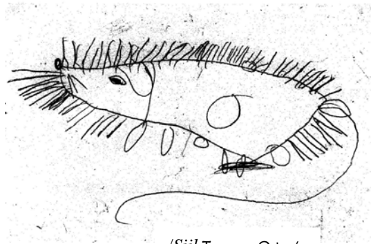
/Siil Toomas Ostra/

INIMESI NÄHES TURTSUB SIIL NÜÜD ALATI VIHASELT: INIMESED NEED JU OLID, KELLE TÕTTU TA KAOTAS NII OMA JALGADE VÄLEDUSE KUI OMA TARGA MÕISTUSEGI.