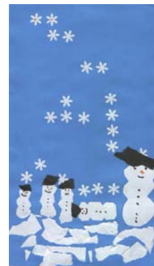
/Memmed Joonatan Betlem/

Detsembrikuu esimese teisipäeva õhtupoolikul kogunesid Virsiku klassi viltimishuvilised kasvatajad, abiõpetajad ja õpetajad, et koos viltimistehnikaga tutvust teha. Algselt planeeritud käsitööga tegelemise õhtu kujunes aga tõeliseks meeskonnatöö koolituseks, kus toimus pidev uute omandatud teadmiste ja kogemuste üksteisele jagamine. Valmistasime kauneid kübaraid, susse ja vaipu, palju positiivset energiat koos usuga oma võimetesse. Peale selle said kõik osalejad rikkamaks koos tegutsemise kogemuse võrra. Selline kogemus tuleb kindlasti kasuks ka igapäevases töös laste õpetamisega seotud probleemide lahendamisel. Alahinnata ei saa ka kogemust, mille said kõik hoolduskooli õpilased vilditud esemetest koostatud näituse avamisel osalemisega.